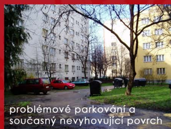
problémové parkování a současný nevyhovující povrch