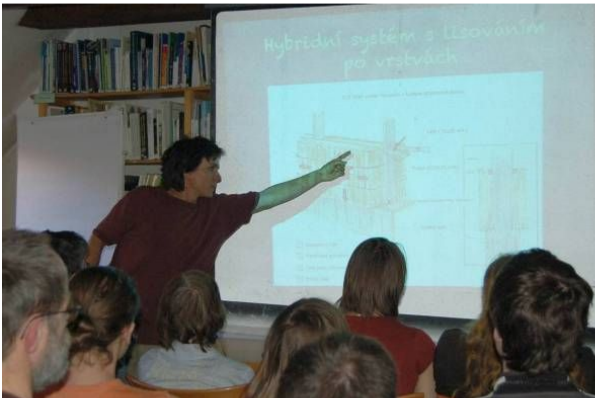
Beseda o ekologickém stavění

O úsporách energie a ochraně klimatu, a také prevenci světelného znečištění v souvislosti s veřejným osvětlováním jsme brněnskou veřejnost informovali formou již tradiční noční exkurze s názvem Brněnský světelný cirkus .