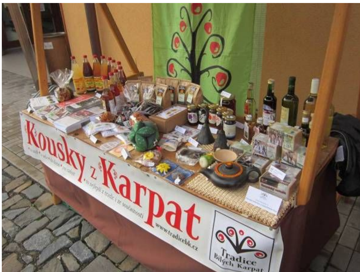
Prezentace výrobků s regionální značkou Tradice Bílých Karpat

Výrobky se značkou TBK jsme prezentovali na 6 akcích (slavnosti, jarmarky).