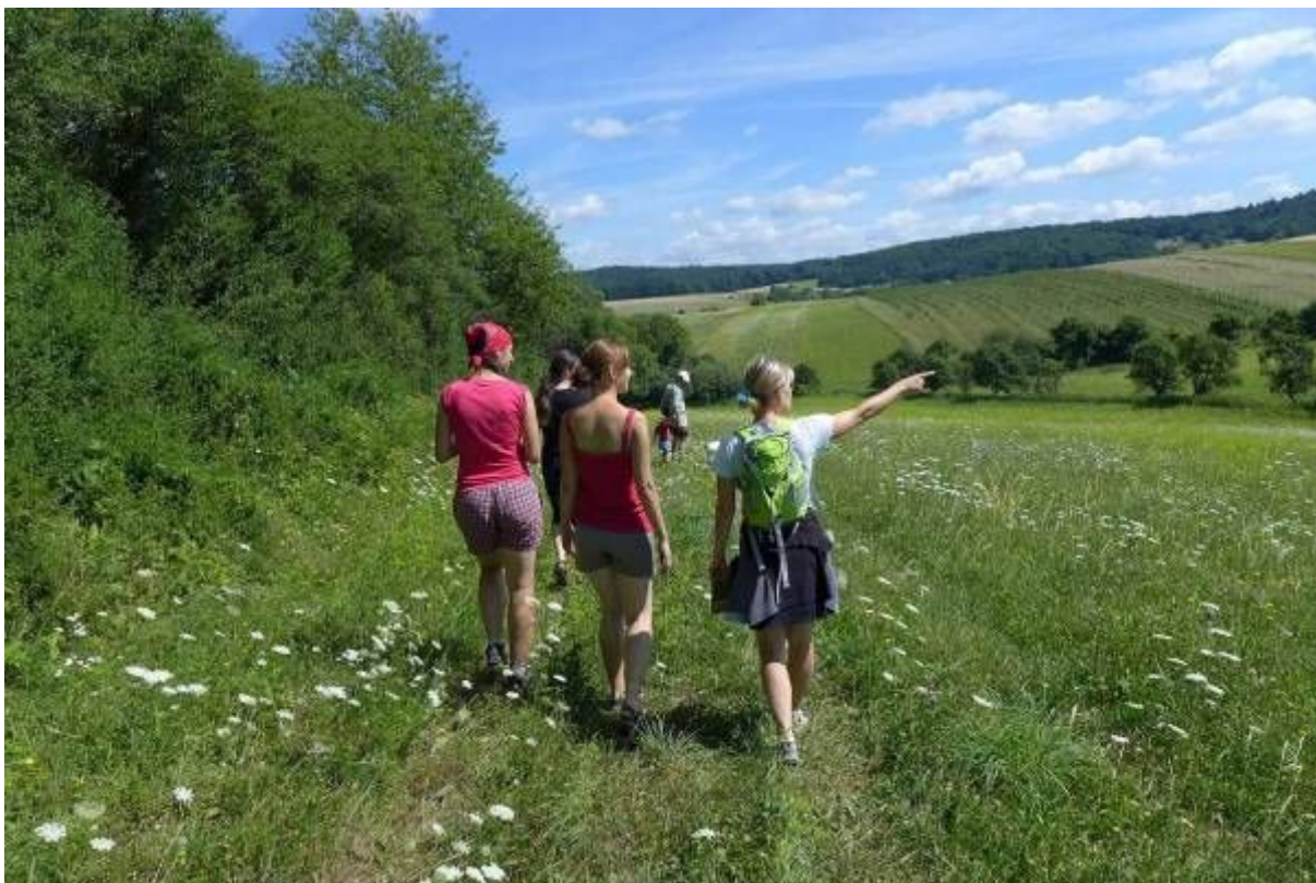
Exkurze do krajiny Bílých Karpat