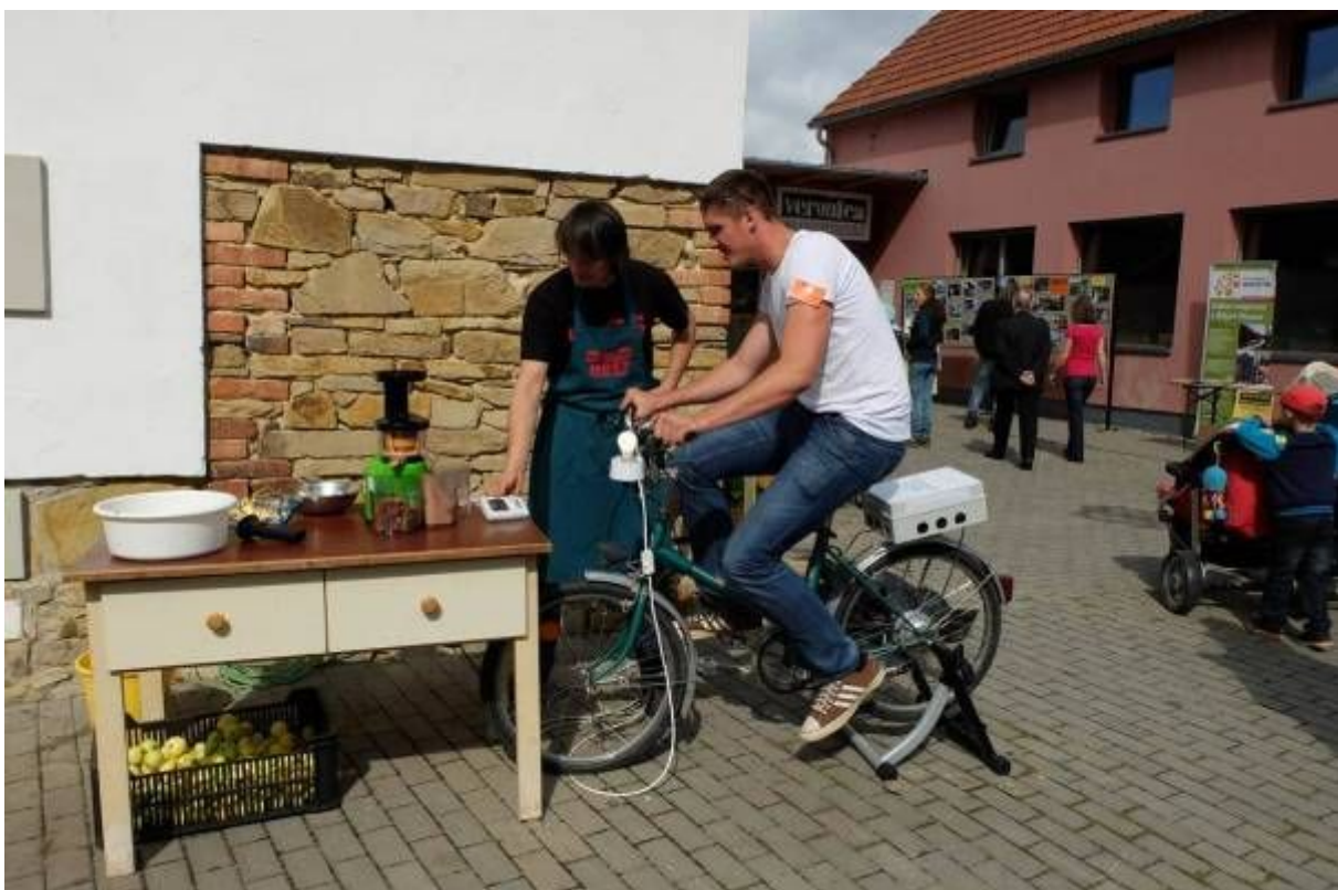
Na našem kole si můžete vlastnoručně (vlastnonožně) ovyšlapat a vytlačit jablečný mošt