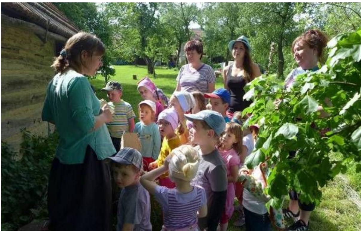
Přírodní zahradu a život v ní ukazujeme už i těm nejmenším – zde při výukovém programu Živá zahrada.