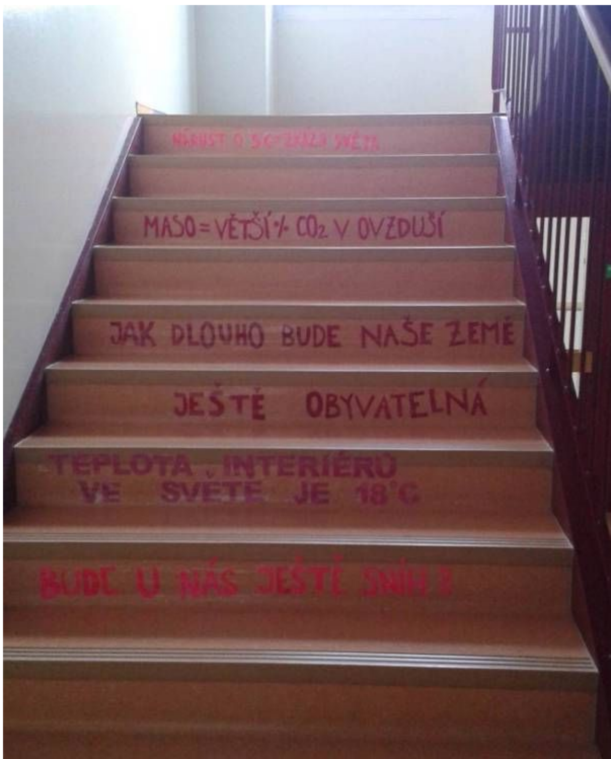
Zajímavá forma „nástěnky“ jednoho ze soutěžních školních týmů CO 2 ligy