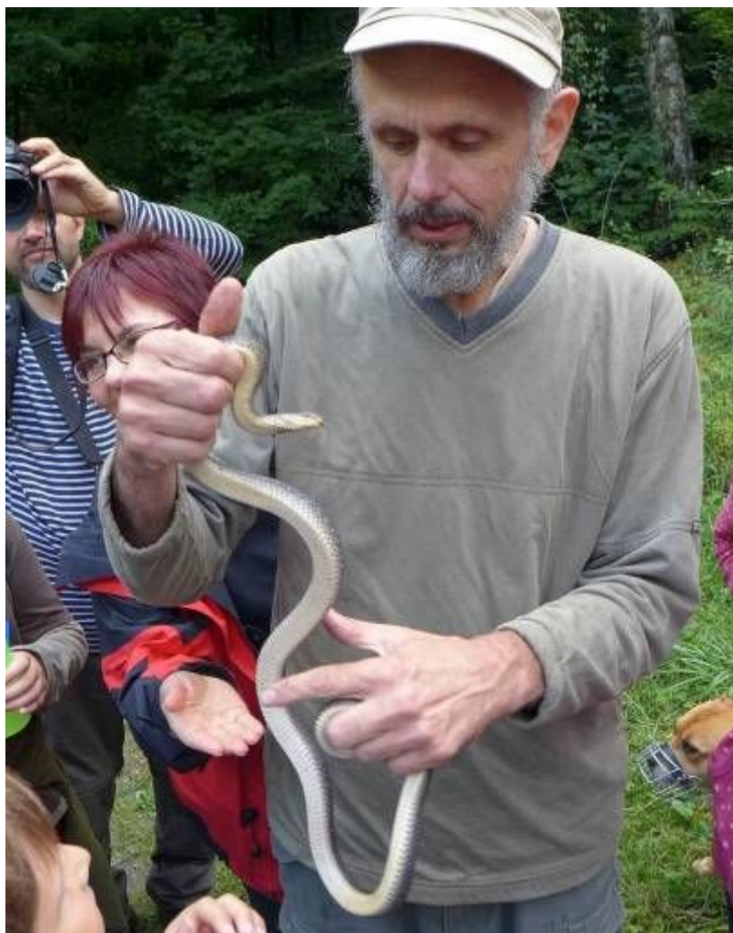
Exkurze Za hady Bílých Karpat

Podíleli jsme se na záchranném programu užovky stromové ve spolupráci s AOPK Praha a také se Správou CHKO Bílé Karpaty. Ve Vlárském průsmyku jsme dobudovali další líhniště pro tyto hady v opuštěném lomu nad Svatým Štěpánem. V tomto místě byla instalována také naučná tabule o ochraně užovky stromové. Pravidelně jsme monitorovali nejdůležitější biotopy a v rámci faunistického průzkumu hledali další lokality. V souvislosti s tím jsme uspořádali 4 exkurze za hady pro širší veřejnost do Vlárského průsmyku. Našimi aktivitami jsme významně přispěli k výzkumu a ochraně tohoto kriticky ohroženého druhu.