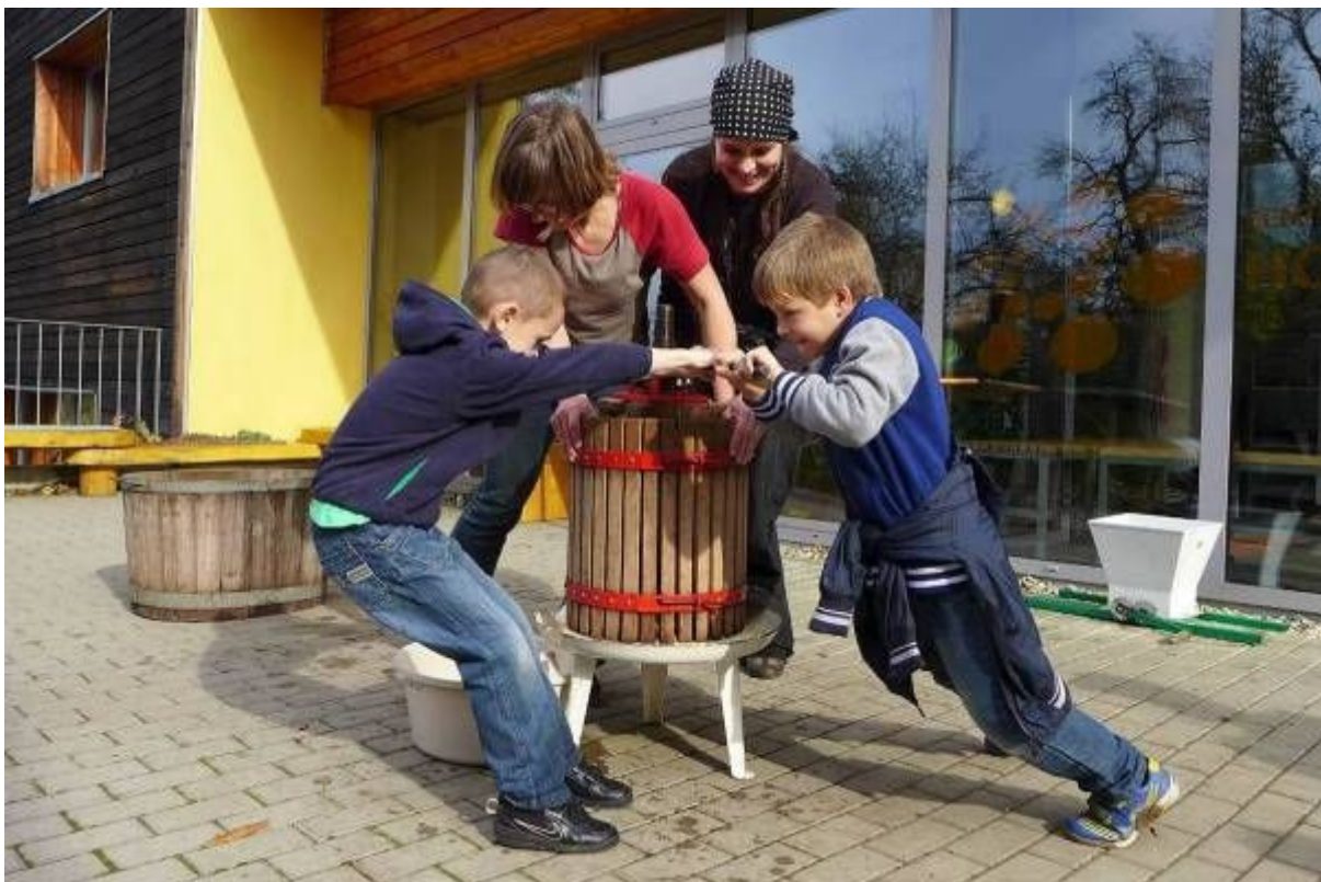
Při výukovém programu Piju mošty, což Ty? si žáci sami lisují vlastní jablečný mošt