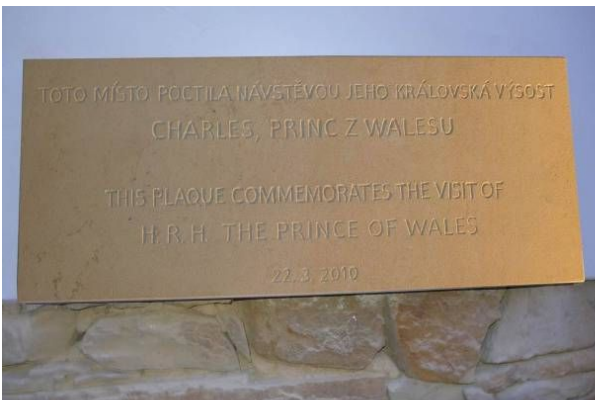
Pamětní desku připomínající návštěvou britského prince Charlese jsme nechali zhotovit k 5. výročí jeho pobytu v Hostětíně (2010 – 2015)