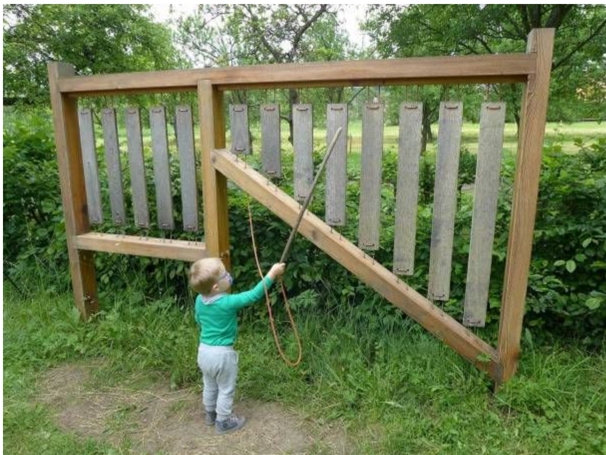
Jeden z mnoha interaktivních prvků v naší zahradě - xylofon

Koordinovali jsme kampaň středisek EVO Zlínského kraje Přírodní zahrady , která probíhala v měsících květnu a červnu. Kampaň byla zakončena Zahradní slavností, která se konala v Ukázkové přírodní zahradě Centra Veronica Hostětín. Akce probíhala jako součást Farmářských slavností organizovaných Ministerstvem zemědělství.