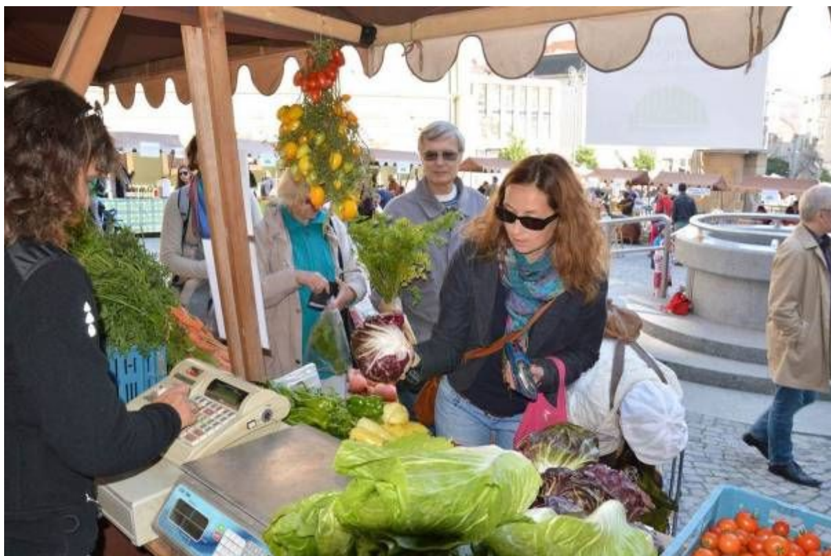
Z brněnského Biojarmarku

Dvacátý čtvrtý ročník již tradičního Brněnského biojarmarku se konal 2. a 3. října v horní části Zelného trhu. Zúčastnilo se jej 16 zemědělců a prodejců s občerstvením, biopotravinami, ochrannými prostředky pro ekologické zemědělství, 2 neziskové organizace, přišlo přibližně 1500 návštěvníků. Poradna Ekologického institutu Veronica poskytovala nejen seznam s kontakty na všechny prodejce biojarmarku, ale i rady týkající se potravinových alternativ – ať už komunitou podporované zemědělství, bio bedýnky nebo ekologicky šetrné restaurace a rovněž o souvislostech produkce a spotřeby potravin s ohledem na jejich vliv na zdraví, změnu klimatu a udržitelný rozvoj. Ve spolupráci s radnicí Brno - střed proběhl odborný kulatý stůl na téma BIO na Zelném trhu. Děti si mohly samy vylisovat jablečný mošt.